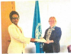
Le 14 juin 2023, Ambassadeur Elisa NKERABIRORI présente à Madame Tatiana VALODAYA, Directrice Générale de l'Office des Nations Unies à Genève, les pouvoirs l'accréditant comme Représentant Permanent du Burundi auprès de l'Office des Nations Unies à Genève